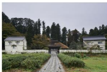
石山を背景に石蔵を構えるかつての採石業者の屋敷