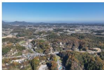
大谷石を産出する凝灰岩の丘陵が広がる大谷地域

当該文化的景観は、北関東内陸部の農村が、近世に農家の副業として始められた採石を近代以降に地場産業とし、奇岩群等を信仰・観光の対象としながら、発展してきたことを伝え、貴重です。