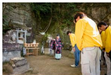
採石の安全を祈願する例祭が継承されている山ノ神を祀る神社