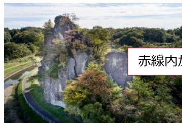
姿川が丘陵を侵食し形成した奇岩群